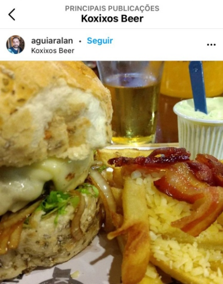
aguiaralan · Seguir Koxixos Beer Curtido por bruno.cav e outras 302 pessoas aguiaralan Por que a sexta feira pede. #koxixosbeer #lanche #30anosday #floripa #comida #muitobom

joidanna Fim de tarde delicioso ♥ aprovadíssimo o bolinho de feijoada! Novidade do cardápio pra disputar com a amada coxinha! Pra completar, companhia das louras! @chaxalima e @eisenbahn! #Tintim #vivaaquarta #logomaxtemfigueira #koxixos #koxixosbeer