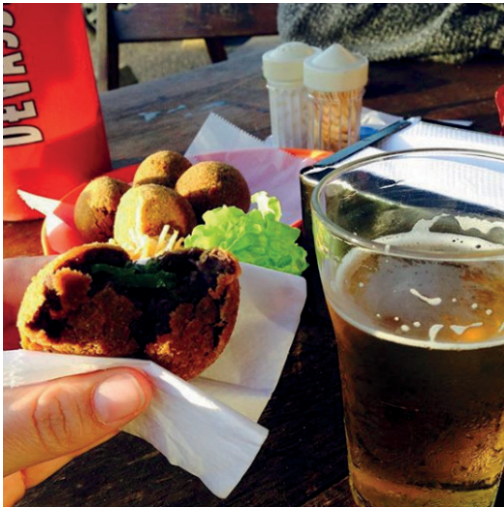
joidanna Koxixos Beer

joidanna Fim de tarde delicioso ♥ aprovadíssimo o bolinho de feijoada! Novidade do cardápio pra disputar com a amada coxinha! Pra completar, companhia das louras! @chaxalima e @eisenbahn! #Tintim #vivaaquarta #logomaxtemfigueira #koxixos #koxixosbeer