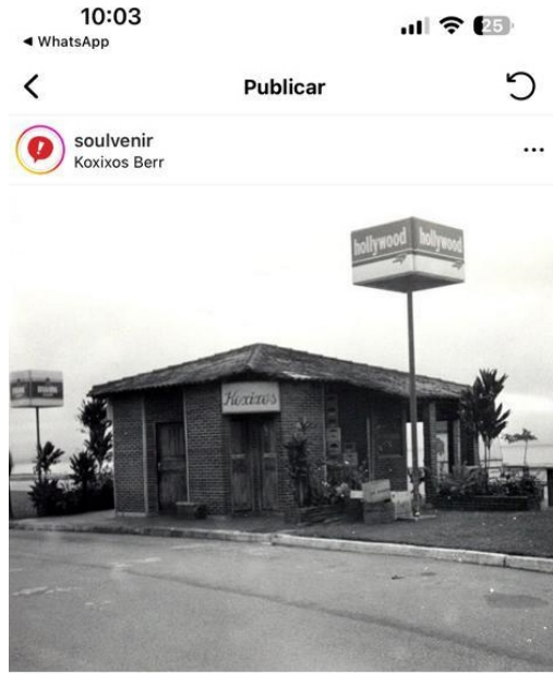
soulvenir Koxixos Beer

Curtido por koxixosbeer e outras pessoas soulvenir #TBT Lembra aquela vez no Koxixo's